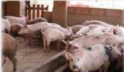
PORCHETA UMBA (15 838 900)