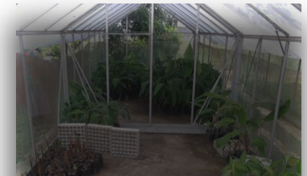
KPM DE BASES (11 898 240)

Réparation des pompes d'injection et mécaniques générale