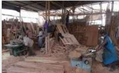
BOIS CHIC (16 700 000)

Installation et maintenance de systèmes photovoltaïques