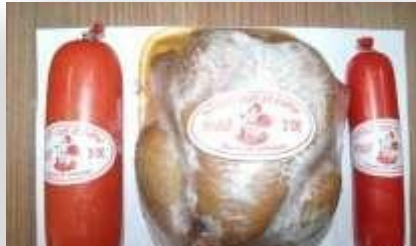
POULET D'OR (7 300 000)