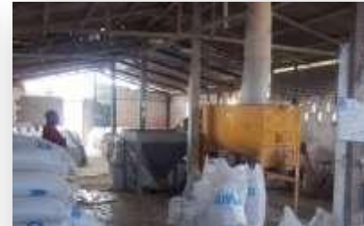
KUBAKASSANA (17 607 300)