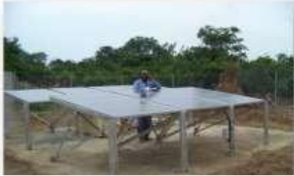
CAGIDIAX (15 915 440)

Installation et maintenance de systèmes photovoltaïques