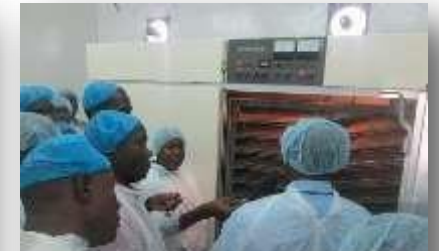
FAHL VETO (16 050 515)