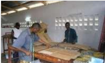
FILAU (25 500 000)