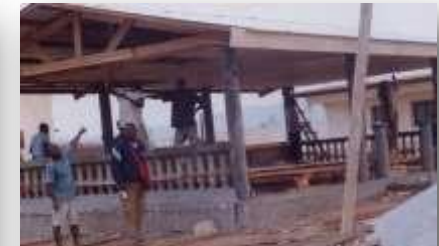
MEUBLES ELVIS (7 898 240)