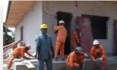
BJ SERVICES (15 700 000)